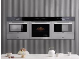
Foto 2: ContourLine von Miele: Hier setzt Miele bewusst auf einen hohen Edelstahlanteil. Die Geräte rücken so in den Blickpunkt.