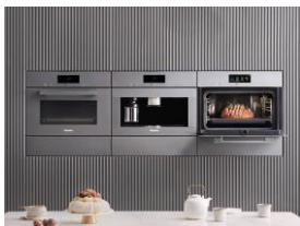
Foto 1: Miele-Einbaugeräte im VitroLine-Design, hier in der Farbe Graphitgrau: Das Ensemble aus Combi-Dampfgarer, Kaffeevollautomat, Kompakt-Backofen mit Mikrowelle (v.l.) plus zwei Wärmeschubladen und eine Vakuumierschublade (jeweils untergebaut) lässt keine Wünsche offen.