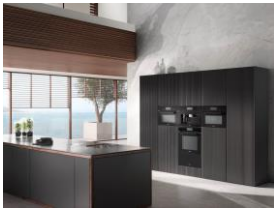
Foto 3: VitroLine-Einbaugeräte von Miele angeordnet in T-Form: Charakteristisch für diese Designlinie ist der hohe Glasanteil – hier in der Farbe Obsidianschwarz – und der Metallgriff mit Glaseinleger in Frontfarbe.