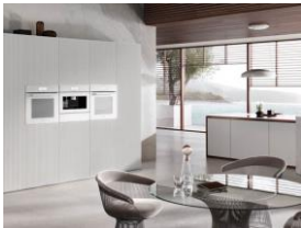
Foto 4: Ganz in Brillantweiß: Dieses Geräteensemble aus Dialoggarer, Kaffeevollautomat, Backofen (v.l.) und untergebauter Wärmeschublade gehört zur Designlinie VitroLine. Alternativ gibt es dieses Set auch in den Farben Graphitgrau und Obsidianschwarz.