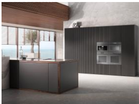
Foto 5: Maximal reduziert: Miele-Einbaugeräte im grifflosen ArtLine-Design, hier in Kubusform angeordnet und in der Farbe Graphitgrau.

Download Text und Fotos: www.miele-presse.de