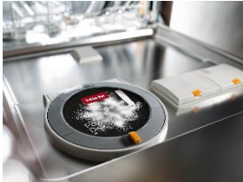
Foto 2: Die PowerDisk befindet sich in einer speziell dafür vorgesehenen Vorrichtung an der Türinnenseite und lässt sich einfach und schnell einsetzen. Die Dosierung des Reinigers erfolgt automatisch durch 360-Grad-Drehungen während des Programms.