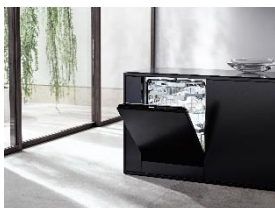
Foto 1: Außergewöhnliche Leistung und Komfort bieten die neuen Geschirrspüler G 7000 von Miele durch das automatische Dosiersystem AutoDos mit integrierter PowerDisk. Vernetzt über WiFi sind sie mobil steuerbar und die neue App-Funktion AutoStart (verfügbar ab 2. Quartal 2019) bietet völlige Freiheit, da diese einen regelmäßigen Start zu vorher festgelegten Zeiten ermöglicht.