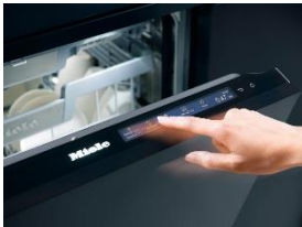
Foto 3: Premiere für M Touch bei den vollintegrierbaren Geschirrspülern. Programme können durch Tippen, Ziehen und Wischen eingestellt werden – einfach und intuitiv. (Foto: Miele)

Foto 2: Die PowerDisk befindet sich in einer speziell dafür vorgesehenen Vorrichtung an der Türinnenseite und lässt sich einfach und schnell einsetzen. Die Dosierung des Reinigers erfolgt automatisch durch 360-Grad-Drehungen während des Programms. (Foto: Miele)