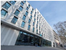
Foto 7: 424 Zimmer gibt es im Hotel am Kölner Neumarkt. Von hier aus sind es nur wenigen Gehminuten bis ins Herz der Innenstadt. (Foto: Miele)

Foto 6: Mathias Gerber, Chef im Motel One am Kölner Neumarkt, ist mit den Miele-Maschinen hochzufrieden: „Sie ermöglichen einen lückenlosen Hygienekreislauf, dessen Zuverlässigkeit wir in jährlich wiederkehrenden Abklatschtestests überprüfen.“ (Foto: Miele)