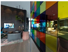
Foto 8: Die Innenausstattung der Lobby greift die Grundstruktur des nahegelegenen Kölner Doms auf – mit Wänden aus Schiefer und bunten Glasinstallationen, die Kirchenfenstern nachempfunden sind. (Foto: Miele)

Foto 7: 424 Zimmer gibt es im Hotel am Kölner Neumarkt. Von hier aus sind es nur wenigen Gehminuten bis ins Herz der Innenstadt. (Foto: Miele)