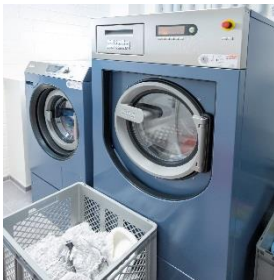
Foto 2: Für die Reinigung der Zimmer und der anderen Gebäudetrakte werden Mopps aus Mikrofaser und Baumwolle gebraucht – je nachdem, auf welchem Bodenbelag sie zum Einsatz kommen. In den Waschmaschinen gibt es die jeweils passenden Programme für die chemothermische Desinfektion. (Foto: Miele)

Foto 1: Hochbetrieb in der Wäscherei von Motel One am Kölner Neumarkt: Vier- bis siebenmal täglich schalten Mohamad Jawad und Florentina Amihaesei die Wäschereimaschinen von Miele ein. Hier werden Reinigungstextilien gewaschen, desinfiziert und getrocknet – wie in insgesamt 14 deutschen Hotels von Motel One. (Foto: Miele)