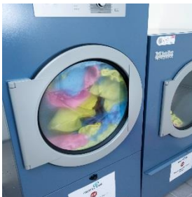
Foto 3: Wärmepumpentrockner schonen mit niedrigen Temperaturen die Reinigungstextilien und sparen gegenüber dem Abluftbetrieb die Hälfte aller Kosten ein. (Foto: Miele)

Foto 2: Für die Reinigung der Zimmer und der anderen Gebäudetrakte werden Mopps aus Mikrofaser und Baumwolle gebraucht – je nachdem, auf welchem Bodenbelag sie zum Einsatz kommen. In den Waschmaschinen gibt es die jeweils passenden Programme für die chemothermische Desinfektion. (Foto: Miele)