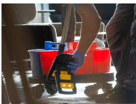
Foto 4: Voller Einsatz für den Parkettboden: Auch vor der Bar wird regelmäßig gewischt. (Foto: Miele)

Foto 3: Wärmepumpentrockner schonen mit niedrigen Temperaturen die Reinigungstextilien und sparen gegenüber dem Abluftbetrieb die Hälfte aller Kosten ein. (Foto: Miele)