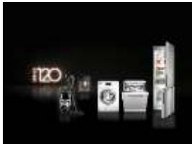
Foto 1: „Series 120“ von Miele: Zum 120-jährigen Bestehen bringt das Unternehmen Aktionsgeräte mit einem Preisvorteil und 120 Tagen Geld-zurück-Garantie in den Handel. (Foto: Miele)

Download Text und Foto: www.miele-presse.de