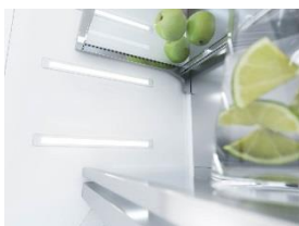
Foto 4: „BrilliantLight“ heißt das Lichtkonzept der neuen Generation der MasterCool-Kühlgeräte. LED-Lichtstreifen sorgen für eine strahlend helle, aber dennoch blendfreie Ausleuchtung des Kühlraums. (Foto: Miele)

Foto 3: Spitzenklasse nicht nur beim Platzangebot: Die neue Generation MasterCool von Miele bietet Kühl- und Gefriergeräte mit Premiumausstattung. (Foto: Miele)