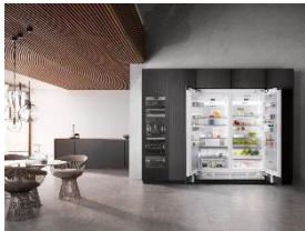
Foto 1: Sie bieten vor allem viel Platz: Kühlgeräte der neuen MasterCool-Generation von Miele. Hier ein Kühl- und ein Gefrierschrank side-by-side, flankiert von einem Weinschrank der Serie.