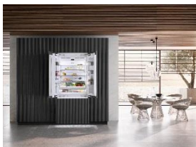
Foto 2: Elegant und praktisch: Große Kühl-Gefrierkombination mit platzsparenden Flügeltüren („FrenchDoor“) der neuen Generation MasterCool von Miele. (Foto: Miele)

Foto 1: Sie bieten vor allem viel Platz: Kühlgeräte der neuen MasterCool-Generation von Miele. Hier ein Kühl- und ein Gefrierschrank side-by-side, flankiert von einem Weinschrank der Serie. (Foto: Miele)