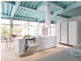
Foto 1: Die Miele-Geschirrspüler G 6770 SCVi/G 6730 SCi sind die besten im Test der StiWa. Besonders gute Noten gab es für den Testsieger bei der Reinigung, dem Geräusch und der Integrierbarkeit.

Download Text und Foto: www.miele-presse.de