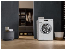
Foto 1: Die Miele-Waschmaschine WDB 330 WPS SpeedCare ist mit der Note 1,6 Testsieger im aktuellen Waschmaschinentest der Stiftung Warentest (test-Ausgabe 11/2019).

Download Text und Foto: www.miele-presse.de