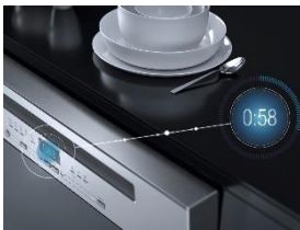
Foto 2: Sauberes Geschirr in nur 58 Minuten – das schafft ein Team aus dem von Miele entwickelten Spülprogramm QuickPowerWash und den darauf abgestimmten 'Ultra Tabs All in 1'.