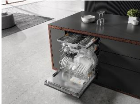
Foto 1: Die neuen Geschirrspüler G 5000 im Einstiegssegment bieten eine Top-Ausstattung zu attraktiven Preisen. Hier im Bild das vollintegrierte Modell G 5265 SCVi XXL.