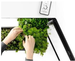
Foto 2: Saisonal völlig unabhängig ist das ganze Jahr über Erntezeit. Eine App informiert über das Wachstum und den richtigen Zeitpunkt, die Pflanzen zu genießen.

Foto 1: Der Plantcube ist nicht größer als ein Standardkühlschrank – und bietet perfekte Wachstumsbedingungen für Salate, Kräuter und Microgreens.