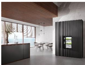
Foto 1: Der Plantcube ist nicht größer als ein Standardkühlschrank – und bietet perfekte Wachstumsbedingungen für Salate, Kräuter und Microgreens.