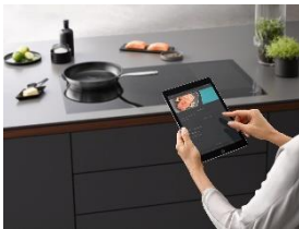
Foto 1: Das smarte Assistenzsystem CookAssist macht das Braten so leicht und sicher wie nie: Schritt für Schritt führt die App auf dem Smartphone oder Tablet durch den gesamten Bratprozess.