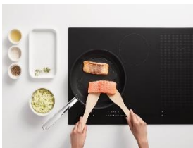
Foto 2: Anspruchsvolle Zutaten wie etwa Lachs gelingen dank CookAssist und den KM 7000 Induktionskochfeldern mit TempControl auf den Punkt. (Foto: Miele)

Foto 1: Das smarte Assistenzsystem CookAssist macht das Braten so leicht und sicher wie nie: Schritt für Schritt führt die App auf dem Smartphone oder Tablet durch den gesamten Bratprozess. (Foto: Miele)