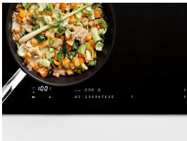
Foto 3: Die Miele KM 7000 Induktionskochfelder mit dem intelligenten TempControl-Sensor sorgen stets für die richtige Temperatur. Damit brennt auch die raffinierte Süßkartoffelpfanne ganz sicher nicht an. (Foto: Miele)

Foto 2: Anspruchsvolle Zutaten wie etwa Lachs gelingen dank CookAssist und den KM 7000 Induktionskochfeldern mit TempControl auf den Punkt. (Foto: Miele)