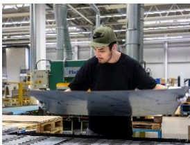
Foto 6: Sorgfältige Kontrolle durch engagierte Mitarbeiter in der Produktion des Miele-Werks Bürmoos – auch dort, wo die Produktion automatisiert wurde.