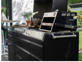
Foto 8: Neuzugang im Produktportfolio von Miele in Bürmoos ist die Produktreihe O.F.B. der Miele-Tochter Otto Wilde Grillers. Hierbei handelt es sich um einen Oberhitze grill, der modellabhängig mit Gas oder Strom beheizt wird, mit hohen Temperaturen arbeitet und weitgehend aus hochwertigem Edelstahl besteht.

Download Text und Fotos: www.miele-presse.de