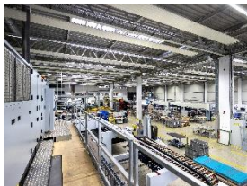
Foto 1: Hochmoderne Fertigung: Das Miele-Werk in Bürmoos bei Salzburg hat sich komplett neu aufgestellt. Allein in den vergangenen vier Jahren wurden acht Millionen Euro investiert.