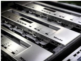
Foto 4: Frontblenden made in Bürmoos – für Haushalts- und Gewerbegeräte. Sie werden heute doppelt so schnell produziert wie früher.