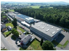
Foto 2: Blick von oben auf das 40.000 Quadratmeter große Werksgelände von Miele im österreichischen Bürmoos.