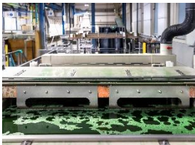
Foto 7: Ein mehrstufiges Fertigungsverfahren ist die Oberflächenbehandlung durch das sogenannte Elektropolieren, unter anderem in Becken mit einer Säuremischung (Foto). Hier wird die Rauheit von Edelstahl-Oberflächen reduziert, sodass extrem glatte Oberflächen entstehen. Wichtig ist dies bei Körben und Einsätzen für Medizin- und Labortechnik.