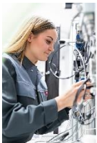
Foto 1: Eine angehende Industriemechanikerin lernt in der Ausbildungswerkstatt im Bereich Hydraulik.