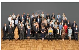
Foto 4: Das Foto zeigt die bei der Feier anwesenden Beschäftigten aus den Vertriebsgesellschaften, die ihr 40- oder 25-jähriges Jubiläum feierten, zusammen mit der Geschäftsleitung. (Foto: Miele)

Foto 3: Das Foto zeigt die bei der Feier anwesenden Beschäftigten des Werkes Bürmoos und der Vertriebsgesellschaft Österreich, die ihr 40- oder 25-jähriges Jubiläum feierten, zusammen mit der Geschäftsleitung. (Foto: Miele)