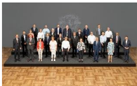
Foto 2: Das Foto zeigt die bei der Feier anwesenden Beschäftigten der Standorte Bielefeld, Euskirchen, Lehrte, Oelde und Warendorf, die ihr 40- oder 25-jähriges Jubiläum feierten, zusammen mit der Geschäftsleitung. (Foto: Miele)

Foto 1: Das Foto zeigt die bei der Feier anwesenden Beschäftigten vom Standort Gütersloh, die ihr 40- oder 25-jähriges Jubiläum feierten, zusammen mit der Geschäftsleitung. (Foto: Miele)