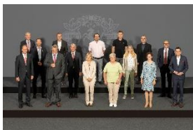
Foto 3: Das Foto zeigt die bei der Feier anwesenden Beschäftigten des Werkes Bürmoos und der Vertriebsgesellschaft Österreich, die ihr 40- oder 25-jähriges Jubiläum feierten, zusammen mit der Geschäftsleitung. (Foto: Miele)

Foto 2: Das Foto zeigt die bei der Feier anwesenden Beschäftigten der Standorte Bielefeld, Euskirchen, Lehrte, Oelde und Warendorf, die ihr 40- oder 25-jähriges Jubiläum feierten, zusammen mit der Geschäftsleitung. (Foto: Miele)