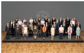
Foto 1: Das Foto zeigt die bei der Feier anwesenden Beschäftigten vom Standort Gütersloh, die ihr 40- oder 25-jähriges Jubiläum feierten, zusammen mit der Geschäftsleitung.