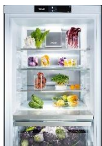
Foto 1: Nachhaltige Leistung: Die neuen Miele Stand-Kühlgeräte K 4000 mit qualitativ hochwertigen Vakuum-Isolationspaneelen für langanhaltende Effizienz.