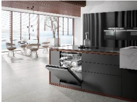
Foto 1: Fast alle Miele-Geschirrspüler der Reihe G 7000 erfüllen die strengen Grenzwerte der Energieeffizienzklasse A.