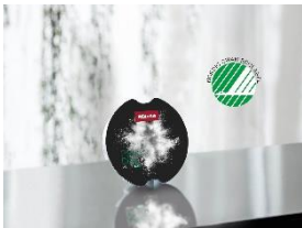
Foto 3: Einzigartiges Dosiersystem: AutoDos mit PowerDisk gibt nur die tatsächlich nötige Menge an Reiniger ab, abhängig vom gewählten Programm oder dem Grad der Verschmutzung.

Download Text und Fotos: www.miele-presse.de