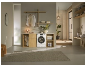
Foto 2: Zwei Miele-Waschmaschinen sind Testsieger in der aktuellen Ausgabe der Stiftung Warentest. Von Mai bis Juni erhalten Kundinnen und Kunden 100 Rabatt auf die von der Stiftung Warentest getesteten Miele-Geräte. (Foto: Miele)

Foto 1: Der Miele-Wärmepumpentrockner TEF 775 WP ist alleiniger Sieger bei der Stiftung Warentest und punktet besonders beim Trocknen und bei den Umwelteigenschaften. Jetzt gibt es für Kundinnen und Kunden 100 Euro Rabatt. (Foto: Miele)