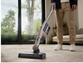
Foto 4: „Neuer Spitzenreiter und einziger guter Neuling“ im Akku-Staubsauger-Vergleich der Stiftung Warentest: Der Miele Triflex HX2 Sprinter. Bei diesem und weiteren Modellen sparen Kundinnen und Kunden im Aktionszeitraum bis zu 50 Euro.