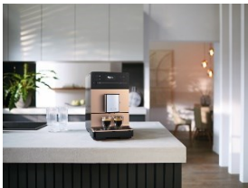
Foto 5: Der CM 5510 Silence bietet höchsten Kaffeegenuss kombiniert mit intuitiver Bedienung, einfacher Reinigung und modernem Design – und ist auch noch besonders leise. Auf dieses Modell gibt es 70 Euro Rabatt. (Foto: Miele)

Foto 4: „Neuer Spitzenreiter und einziger guter Neuling“ im Akku-Staubsauger-Vergleich der Stiftung Warentest: Der Miele Triflex HX2 Sprinter. Bei diesem und weiteren Modellen sparen Kundinnen und Kunden im Aktionszeitraum bis zu 50 Euro. (Foto: Miele)