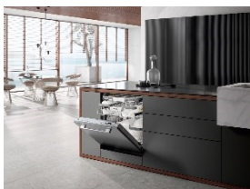
Foto 3: Der vollintegrierte Miele-Geschirrspüler G 7160 SCVi AutoDos ist Testsieger bei der Stiftung Warentest. Das Gerät erhält Bestnoten für Handhabung, beim Geräusch und bei der Sicherheit. Zudem hat es die geringsten Betriebskosten im Nutzungszeitraum. (Foto: Miele)

Foto 2: Zwei Miele-Waschmaschinen sind Testsieger in der aktuellen Ausgabe der Stiftung Warentest. Von Mai bis Juni erhalten Kundinnen und Kunden 100 Rabatt auf die von der Stiftung Warentest getesteten Miele-Geräte. (Foto: Miele)