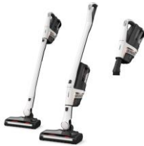
Foto 3: Ein praktisches Merkmal der Triflex-Modelle von Miele ist das patentierte 3in1-Design für besondere Flexibilität.

Download Text und Fotos: www.miele-presse.de