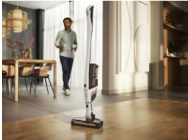
Foto 1: Der Triflex HX2 CarCare ist alleiniger Testsieger im aktuellen Test der Stiftung Warentest (Ausgabe 10/2024).