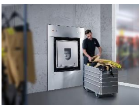
Foto 1: Waschmaschinen in Trennwandausführung bereiten Feuerwehr-Schutzanzüge auf. Die beiden voneinander getrennten Seiten verhindern, dass gelöste Schmutzpartikel auf gereinigte Textilien gelangen.