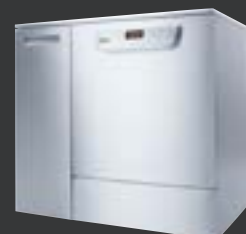
PG 8583 CD