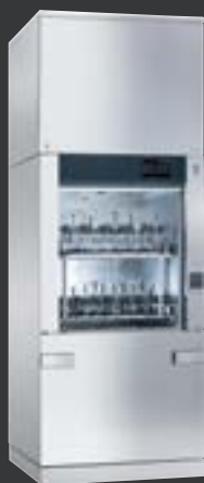
PLW 8615 / PLW 8616

Beim Kauf eines Laborspülers PG 8583, PG 8583 CD, PG 8593 zusammen mit mindestens einem EasyLoad Modul im selben Auftrag erhalten Sie von Miele einen EasyLoad-Bonus von 400,- € brutto nach dem Kauf. Beim Kauf eines SlimLine Laborspülers PLW 7111 zusammen mit mindestens einem EasyLoad Modul im selben Auftrag erhalten Sie einen EasyLoad-Bonus von 800,- € brutto nach dem Kauf. Beim Kauf eines Großraum Laborspülers PLW 8615, PLW 8616, PLW 8617 zusammen mit mindestens einem EasyLoad Modul im selben Auftrag erhalten Sie einen EasyLoad-Bonus von 1200,- € brutto nach dem Kauf. Den Laborbonus erhalten gewerbliche/freiberufliche Endkunden, die nach dem Kauf eines der Aktionsgeräte eine Kopie ihrer Rechnung und die zur Zahlungsabwicklung notwendigen Angaben online bei Miele bis maximal 30 Tage nach Rechnungsdatum einreichen unter: www.miele.de/professional/saubereresultate . Die Aktion gilt nur für in der Bundesrepublik Deutschland gekaufte Geräte. Eine Auszahlung erfolgt nur in Länder, in denen der Euro gültiges Zahlungsmittel ist. Die Aktion ist mit keinen anderen Miele Professional Aktionen kombinierbar.