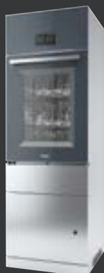
SlimLine PLW 7111